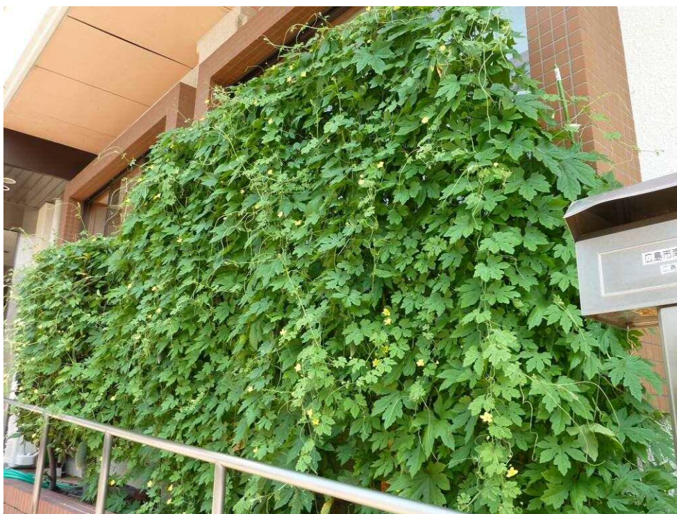
(グリーンカーテン作り)